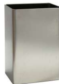
CONTENITORE 2 LT