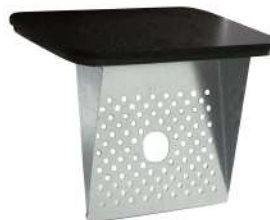
TESTA CON GRIGLIA