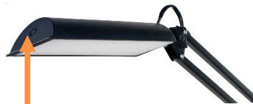
Dimmer sulla calotta