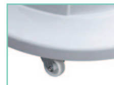
Ruote con freno