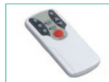
Telecomando a infrarossi per tutte le funzioni