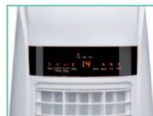
Display digitale con comandi elettronici e sensore temperatura uscita aria