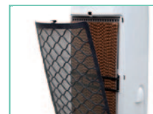
Pannello rinfrescante e filtro antipolvere