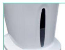
Serbatoio con galleggiante per controllo visivo del livello acqua e segnale sonoro per mancanza acqua