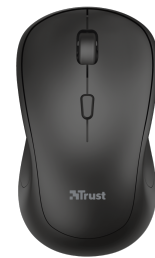
PRODUCT TOP 1