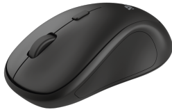
PRODUCT VISUAL 1