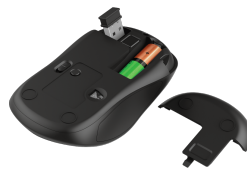
PRODUCT BOTTOM 1