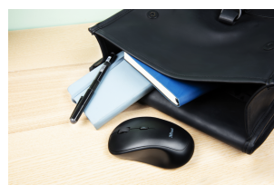
LIFESTYLE VISUAL 1