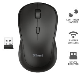
PRODUCT ESHOT 1