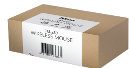
PACKAGE VISUAL 1