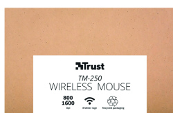
PACKAGE FRONT 1