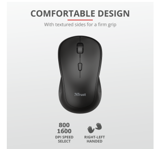
PRODUCT PICTORIAL 2