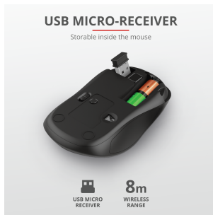
PRODUCT PICTORIAL 3