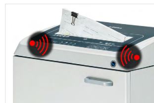
METAL DETECTION SYSTEM SHRED GUARD

Il sistema Shred Guard ferma il distruggidocumenti quando rileva oggetti metallici di grandi dimensioni, tali da poter danneggiare i coltelli di taglio. Un indicatore luminoso avverte l'operatore della necessità di rimuovere questi oggetti.