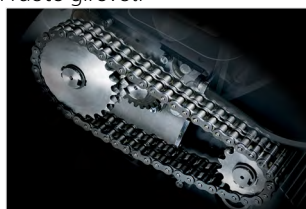
SUPER POTENTIAL POWER UNIT

Segnalala capacità distruttiva utilizzata e quella ancora disponibile per ottimizzare le distruzioni senza inceppamenti.